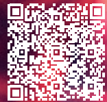
QR-Code zur Serie

wohl in New York grundlegend andere Perspektiven Raum einnehmen könnten als in Deutschland, habe es sich komisch angefühlt, nur im amerikanischen Kontext zu schreiben, er habe den deutschen Kontext ins Zentrum stellen wollen.