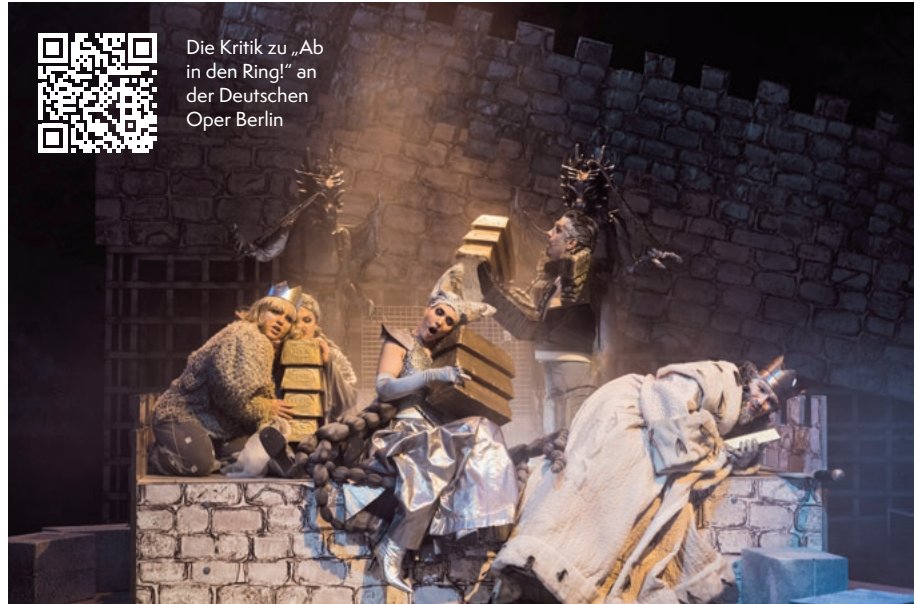
Die Kritik zu „Ab in den Ring!“ an der Deutschen Oper Berlin

Begonnen aber hat alles mit Jacques Offenbach. Als er in den 1850ern seine ersten Einakter aus dem Geist des sub-