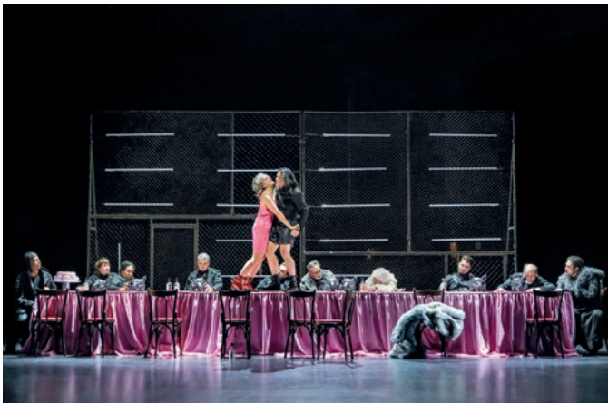
1 Schauspiel Dortmund, Uraufführung: 1.2.26 SAM MAX: ‚PIDOR‘ UND DER WOLF

„Es gibt kein moralisch-gut und keine Hoffnung. Stattdessen konfrontiert das Stück sein Publikum mit der Ausweglosigkeit eines gesellschaftlichen Systems, das die Menschenrechte seiner Mitglieder massiv missachtet und sie zum Unterdrücken ihrer Emotionen und ihrer Lebensrealität verurteilt.“ Lea Nitsch