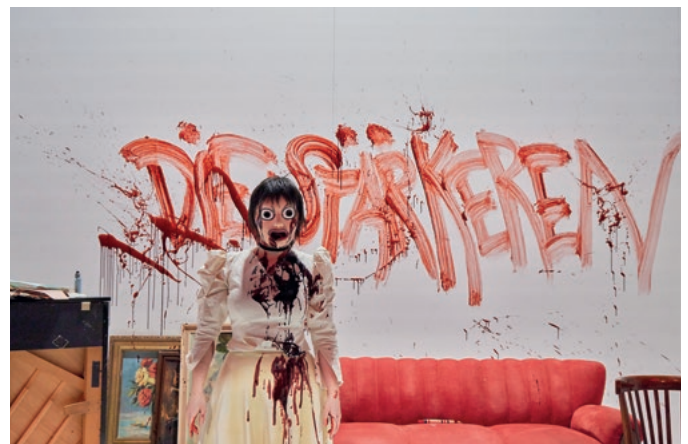
4 Schauspiel Köln, Premiere: 18.12.25 NACH PER OLOV ENQUIST: #1 EIFERSUCHT/DIE NACHT DER LESBEN