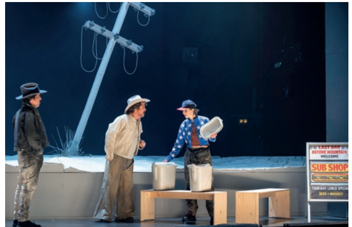
2 Theater Erfurt, Premiere: 28.3.26 CHARLES WUORINEN: BROKEBACK MOUNTAIN

„Es gibt kein moralisch-gut und keine Hoffnung. Stattdessen konfrontiert das Stück sein Publikum mit der Ausweglosigkeit eines gesellschaftlichen Systems, das die Menschenrechte seiner Mitglieder massiv missachtet und sie zum Unterdrücken ihrer Emotionen und ihrer Lebensrealität verurteilt.“ Lea Nitsch