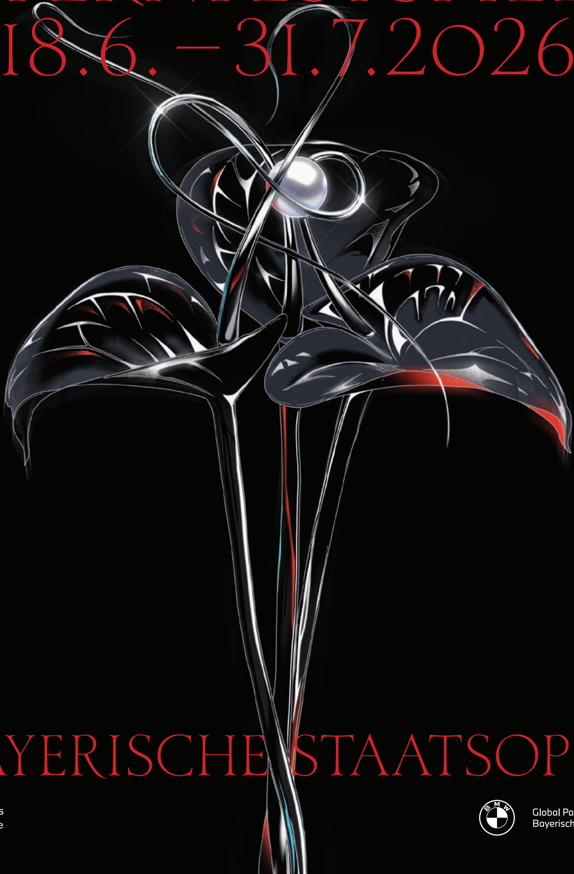
Illustration: Huanhuan Wang