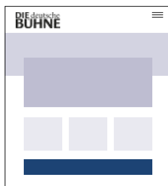
Quer niedrig 1005 x 105 px