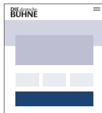
Quer hoch 1005 x 215 px