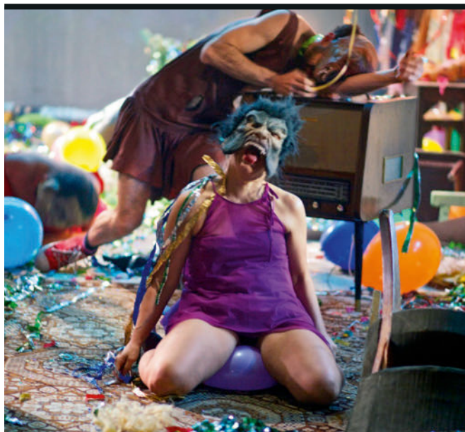
Szene aus „Los incontados“ am kolumbianischen Mapa Teatro. Lateinamerika und seine Theaterlandschaft stehen im Zentrum des „¡Adelante!“-Festivals am Theater Heidelberg

18 PORTRÄT Die Regisseurin Pinar Karabulut